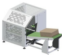
Empileuse compacte 10/15 nappes 10 draps