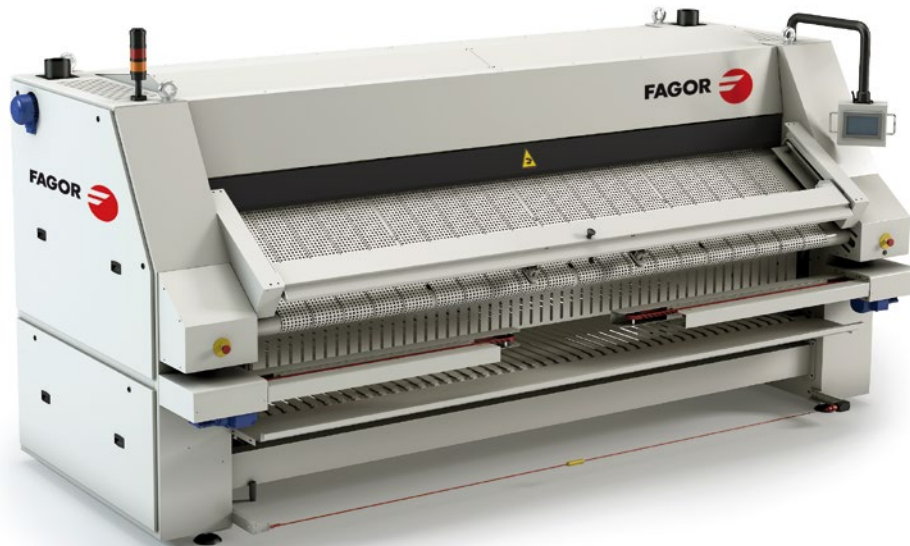
POSEIDON avec option d'introducteur automatique

Les modèles POLARIS, en revanche, ne sont que des sècheuses-repasseuses avec la possibilité de fonctionner comme des machines passantes sans plieuse.