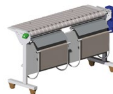
Collecteur de serviettes à deux voies