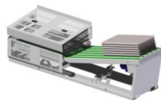
Empileuse compacte ROLL-OFF 5 nappes 10 draps