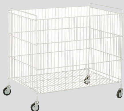
CS-115 / 212 / 365