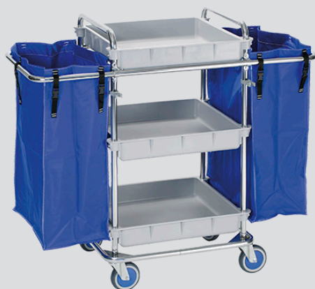
CSH-3 / CSH-4