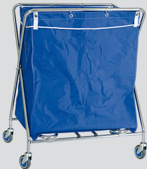
CRS-10 / 20 / 35 / 40