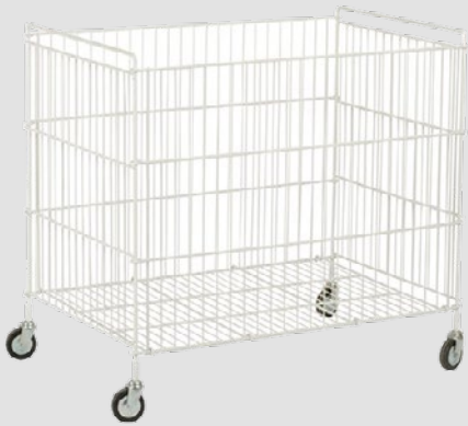
CS-115 / 212 / 365