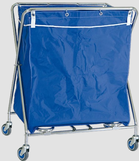
CRS-10 / 20 / 35 / 40