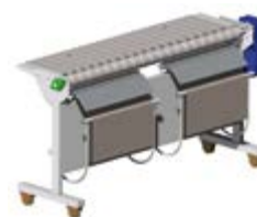
Raccoglitore di tovaglioli a 2 vie