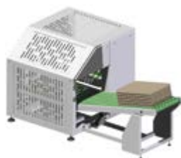
Impilatore compatto 10/15 tovaglie 10 lenzuola