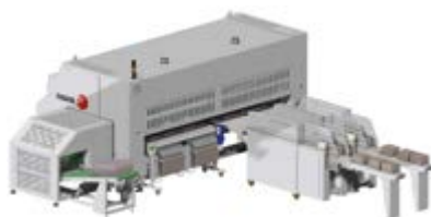
Impilatore compatto + Raccoglitore di tovaglioli a 2 vie + Smarty